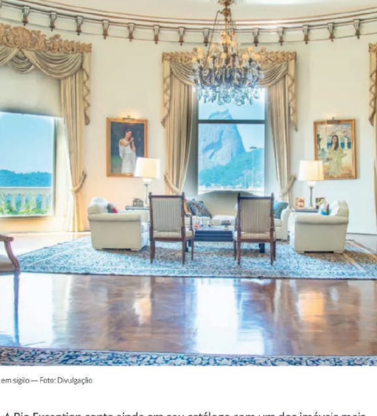
Um vídeo: Venda de imóveis de luxo em Copacabana.

Na Rio Exception, por exemplo, todo o marketing é feito fora do Brasil. “É um investimento de quase 20 mil dólares por ano só para a divulgação nos sites especializados fora do país em que expomos nosso portfólio”, destacou Cano.